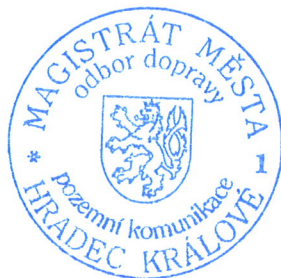
Otisk úředního razítka